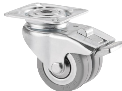
La foto puede diferir del producto original