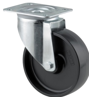
Illustrationen kan afvige fra originalen