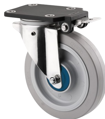
Illustrationen kan afvige fra originalen