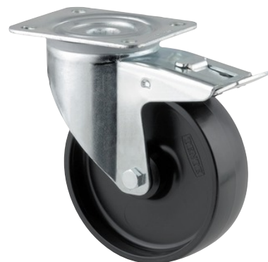
Illustrationen kan afvige fra originalen