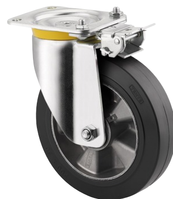
La foto puede diferir del producto original