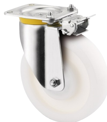
Illustrationen kan afvige fra originalen