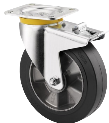
Obrázky se mohou lišit od skutečného produktu