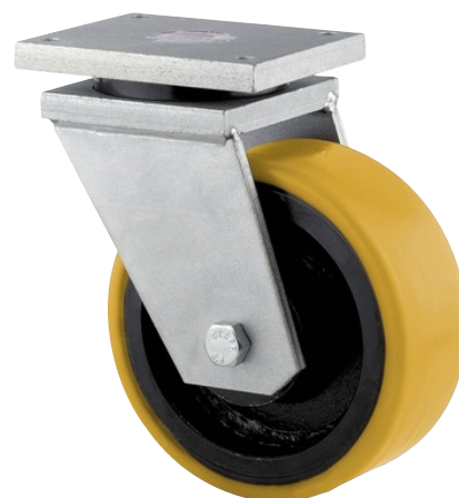
Obrázky se mohou lišit od skutečného produktu