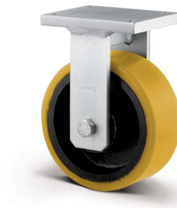
Obrázky se mohou lišit od skutečného produktu