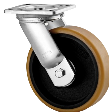
Illustrationen kan afvige fra originalen