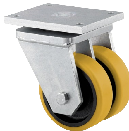
Obrázky se mohou lišit od skutečného produktu