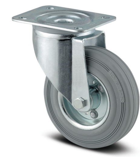
图片可能与原产品不同