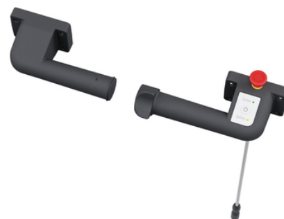
Obrázky se mohou lišit od skutečného produktu