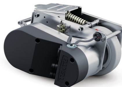
Illustrationen kan afvige fra originalen

E-Drive optima, drive unit with integrated control unit, can be lowered and raised, brushless motor with deceleration function and constant torque. Solid housing made of galvanized sheet steel, the wheel can be replaced by the customer and ordered individually, maintenance-free.