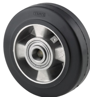
Illustrationen kan afvige fra originalen