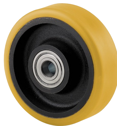
A kép eltérhet az eredeti terméktől