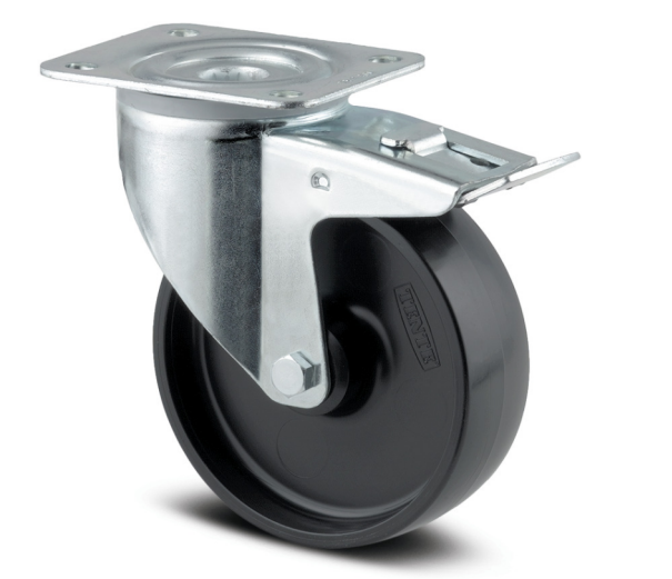
Изображението може да се различава от оригиналния продукт

EAN 4031582305548 Номер на поръчката 00001418