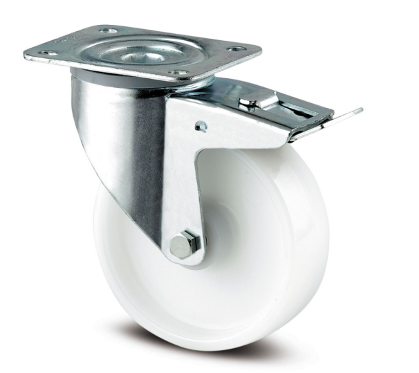
图片可能与原产品不同