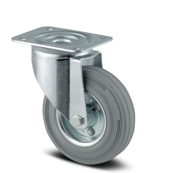
Изображение может отличаться от оригинального продукта