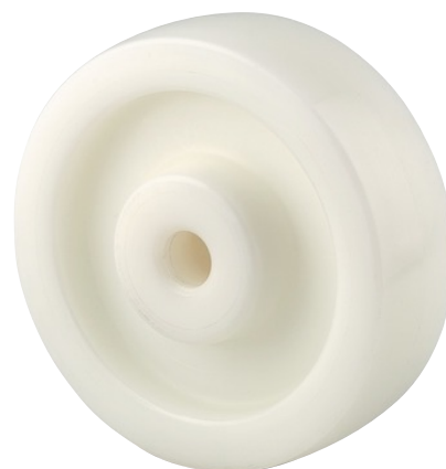
La foto puede diferir del producto original