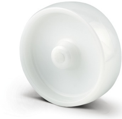
Illustrationen kan afvige fra originalen